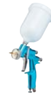
M22 G HPA