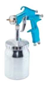
M22 A HPA