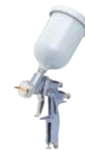
M22 G HTI