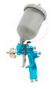
M22 GSP Bote a presión