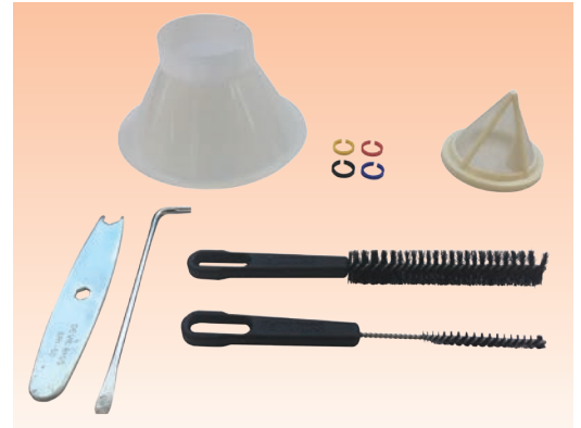
El kit consta de la pistola de pulverización con la combinación de cabezal de aire y boquilla seleccionada, taza de gravedad, embudo, llave, llave Torx y cepillos de limpieza.

Para más información técnica, consulte el Boletín de Servicio de la pistola SRi Pro Lite.